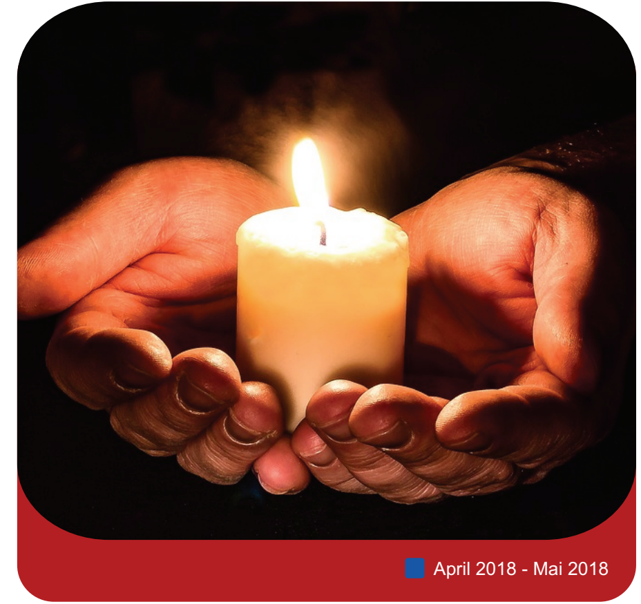
April 2018 - Mai 2018